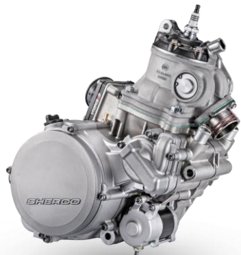
2T STROKE 125