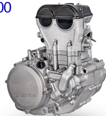
4T STROKE 250-300