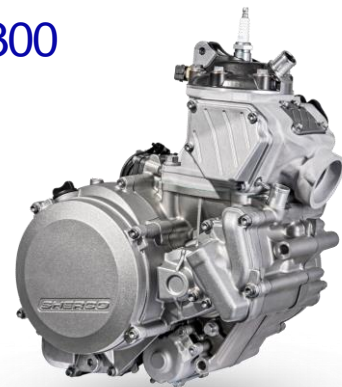
2T STROKE 250-300